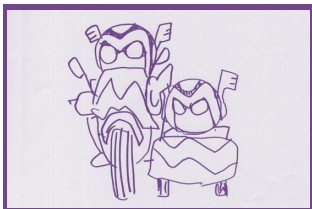
東京都・ひがしやまむつみ(隊員No.623)

本当は、メルドゲイルのサイドカーは前タイヤが1つなんだよ。でもはくりよくまんてん！うまくなっているね！