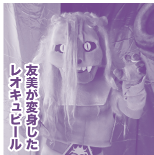
友美が変身したレオキュピール

次期指導者としてみこまれていたこともあり、キュピール怪人としてはトップクラスの強さである。ひとつ間