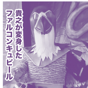
貴之が変身したファルコンキュピール

に根を下ろしてしまおうと、完全に除去する方法がないため今もなおふたりの体内に埋め込まれたままだ。